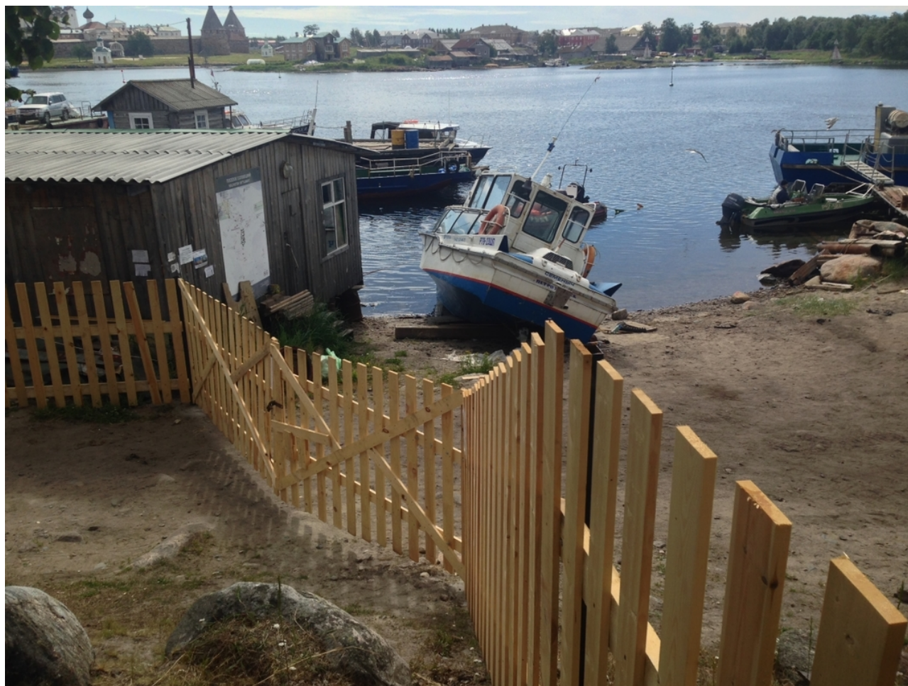
Причал Хета. Июль 2016 года.